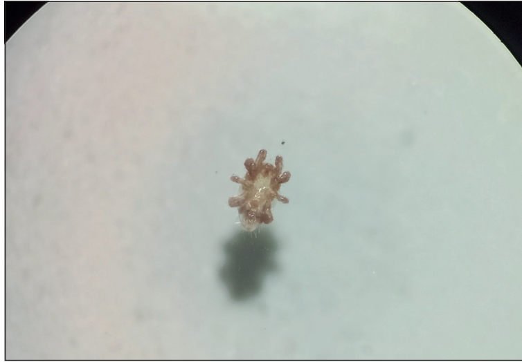
Figura 1. Ácaro de Ornithonyssus sp. extraído de una paciente con dermatitis facial que estuvo en contacto con palomas infestadas. Lupa estereoscópica 10X.