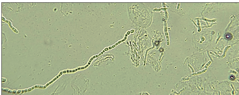
Figura 2. Examen directo con KOH al 20%. Se observa micelio con artroconidios. Microscopía óptica. 40X.

acorde al tipo de lesión, idealmente del lecho ungueal si se encuentra comprometido 11 .