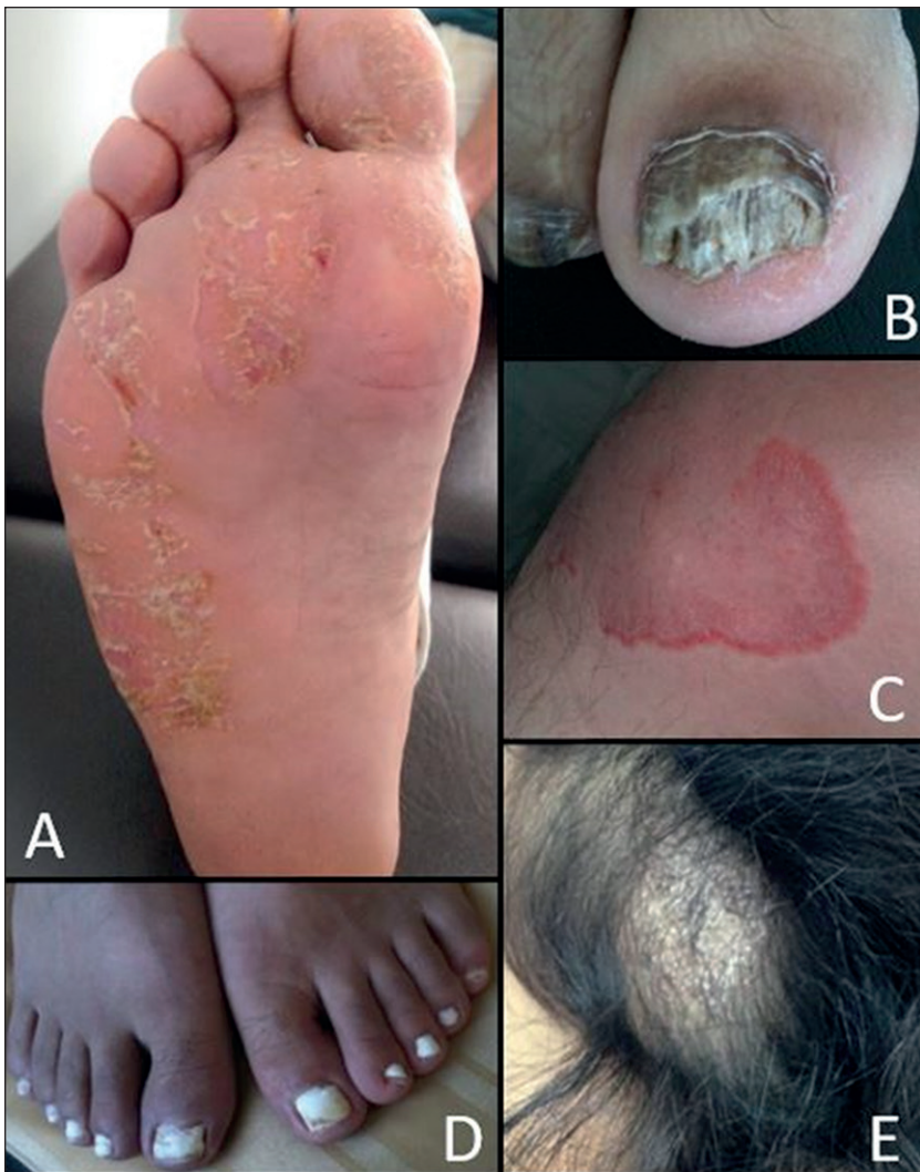
Figura 1. A. Tiña plantar descamativa; B. Onicomiosis con onicolisis; C. Tiña en la rodilla derecha; D. Onicomiosis en ambos pies; E. Tiña de cuero cabelludo.