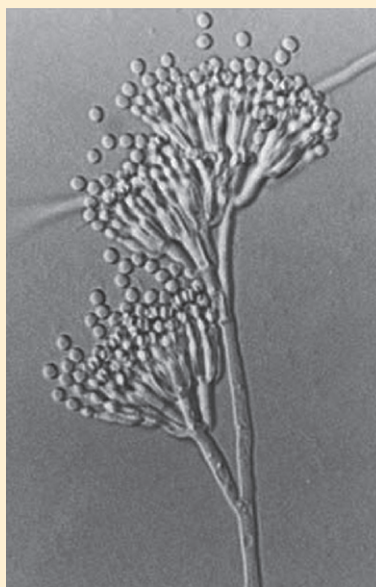
Figura 1. Fotografía del hongo ascomiceto Penicillium chrysogenum.