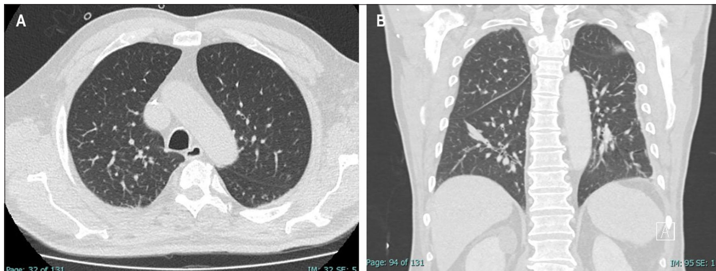
Figura 1. TC de tórax. A: engrosamiento de septos interlobulillares en lóbulos superiores (día 1 del ingreso). B: engrosamiento de los septos interlobulillares en lóbulos superiores y atelectasias subsegmentarias en ambos lóbulos inferiores (día 4 post-ingreso).

El estudio de psitacosis y fiebre Q realizado en el Instituto de Salud Pública (ISP) de Chile resultó negativo. Inició tratamiento con ceftriaxona 2 gr i.v.al día, doxiciclina oral 100 mg cada 12 horas, y