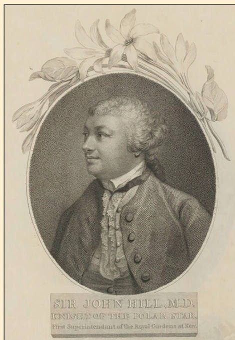
Figura 1. Retrato de Sir John Hill (1716-1775). Grabado realizado por Francis Cotes probablemente en 1757. Disponible en: https://www.lookand-learn.com/history-images/YW002768V/Sir-John-Hill .