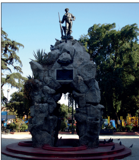
Monumento al roto chileno, Virginio Arias 1888, fotografía de Richard Espinoza.