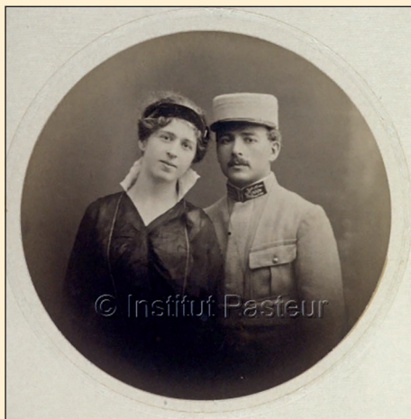
Figura 1. Eugène Wollman y su esposa Elisabeth Wollman. Foto 1905.

Una de las principales áreas de investigación del Dr. Wollman fueron los bacteriófagos recientemente descubiertos 5-9 . Ya en 1925, Wollman propuso la revolucionaria hipótesis que planteaba que ciertos genes [i.e. fagos] podrían tener un mayor grado de estabilidad y ser transmitidos a través del medio externo entre células, llamando a este fenómeno paraherencia (hoy lisogenia). Además, propuso que se debía distinguir entre los verdaderos virus, es decir, entidades independientes de la célula hospedera, y los bacteriófagos que podían ser transmitidos ya sea por herencia o a través del medio 5 . Recordemos que en 1929, tan sólo cuatro años después de su visionaria hipótesis, el Dr. Wollman se embarcó hacia Chile invitado a dirigir el Instituto Sanitas. Estuvo tres años en Chile (1929-1931) dirigiendo esta institución, junto a su esposa e investigadora Elisabeth Wollman y su célebre hijo genetista Élie Wollman, uno de los pioneros de la genética moderna (Figura 1). Wollman trajo a Chile las primeras técnicas para trabajar con bacteriófagos y bajo su alero se formaron y realizaron sus tesis de licenciatura varios microbiólogos que luego pasaron a ocupar importantes cargos. Entre ellos, destacan el médico microbiólogo Felipe González Antolín, quien fue nombrado posteriormente profesor titular de Microbiología en la Universidad Católica