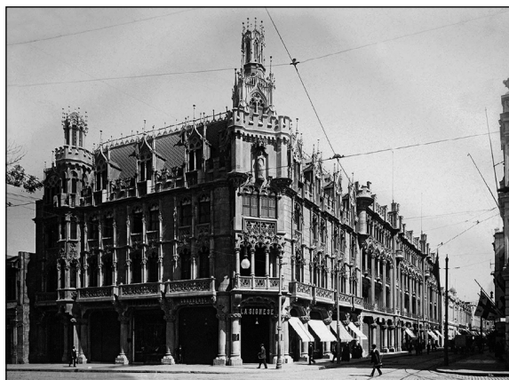
Figura 2. Palacio Undurraga.